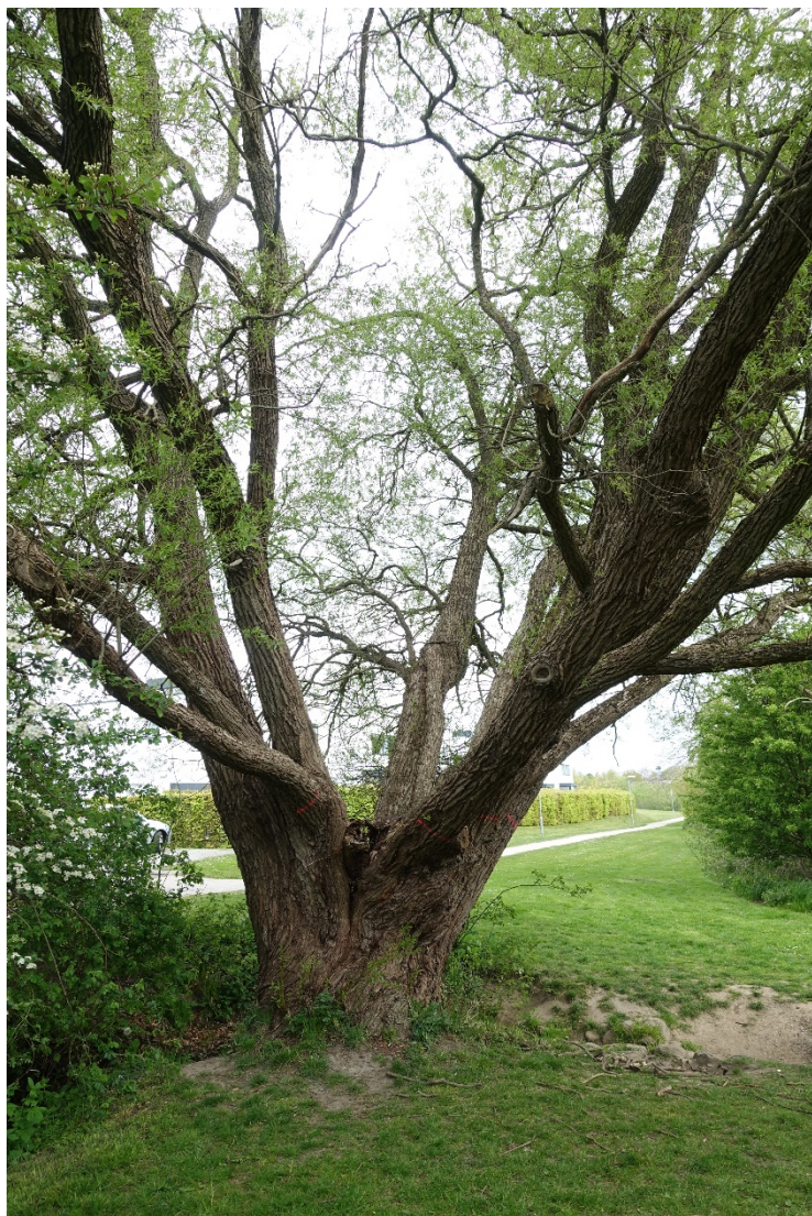
Træ 3. flerstammet pil. Stor og akut risiko for at træet lægger sig ned i alle retninger. Kap lige over delingsstedet. Husk at overveje muligheden for at efterlade stammer til naturlig nedbrydning.