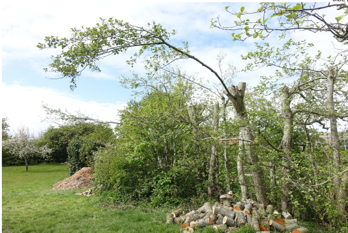
Trægruppe 1. Underligt udført topkapning. Fjern alle lange grene.